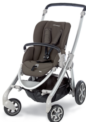
1 poussette au choix*