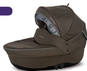
1 nacelle Windoo Plus